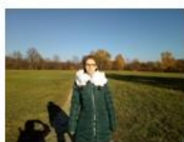
13. Место детских игр М.Ю.Лермонтова