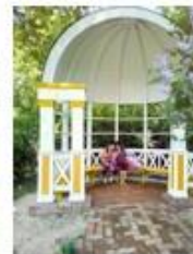
9. Беседка «Тайная»