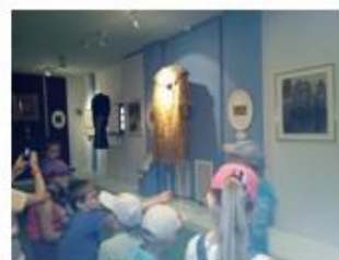
4. Людская изба