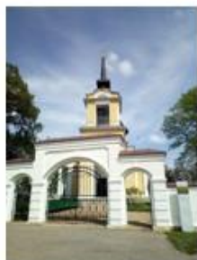
16. Церковь Архангела Михаила