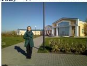
6. Административное здание. Столовая