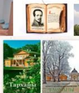
20. Сувенирная лавка