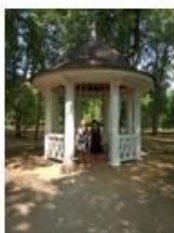
11. Беседка в дальнем саду