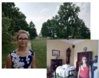
1. Барский дом