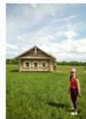
15. Дом мельника