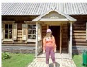
3. Дом ключника