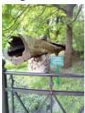
10. Дуб, посаженный Лермонтовым